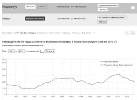
Fig. 1. Données de fréquence pour babuška 'grand-mère'.

D'après les données de fréquence, le terme le plus utilisé aujourd'hui dans les textes littéraires est celui de babuška 7 : il est passé de la cinquième position entre 1950 et 1969 loin devant tous les autres. À titre de comparaison : entre 1950 et 1969, starik '(un) vieux' était trois fois et demi plus fréquent que babuška , les termes tels que ded 'grand-père' ou staruxa '(une) vieille' le devançaient aussi, alors qu'ils sont désormais bien moins fréquents. Cependant, d'après la courbe (fig. 1), après une augmentation majeure jusqu'en 2011, sa fréquence est en dé-crise actuellement.