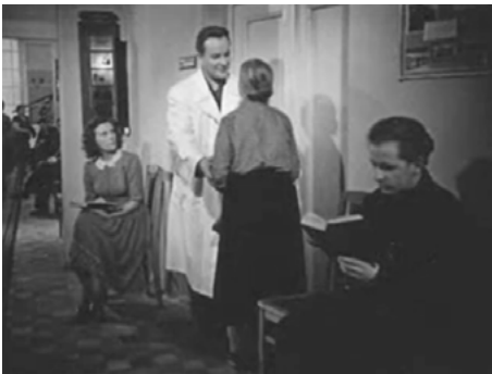
Fig. 2. Image extraite du film « Neokončennaja povest' » (1955).

[Aganin] Une minute, grand-mère. Asseyez-vous, attendez ici. On vous appelle dans un instant.