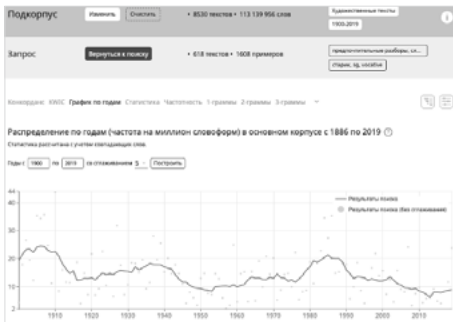
Fig. 14. Données de fréquence pour starik au sg. '(un) vieux' adressatif.

La baisse est forte aussi pour son emploi adressatif : sa fréquence a été divisée par deux depuis les années 1980 (fig.) en passant de 15,34 pour la période 1970-1989 à 7,06 à partir de 2010.