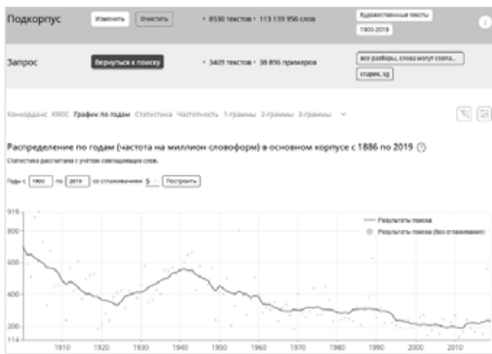
Fig. 13. Données de fréquence pour starik au sg. '(un) vieux'.

Parmi les appellatifs étudiés, starik '(un) vieux' était le terme le plus employé dans notre corpus littéraire jusqu'à la fin des années 2000. On observe la baisse progressive et continue de sa fréquence amorcée en 1940 et qui a été divisée pratiquement par trois depuis. Peut-être que la valeur véhiculée par ce terme a changé : autrefois, il avait un sens plus neutre, car on pouvait l'associer à la sagesse et à l'expérience, aujourd'hui, il a plus facilement des connotations négatives à cause de la dépréciation sociale de la vieillesse.