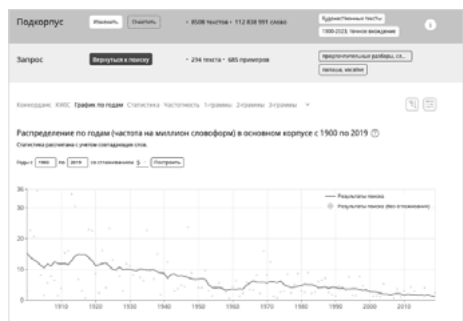
Fig. 8. Données de fréquence pour papaša '(le) petit père' en emploi adressatif.

En revanche, en emploi adressatif, sa fréquence baisse progressivement depuis le début du XXe siècle. Pour la période qui nous intéresse ici, de 4,94 entre 1950 et 1969, il est passé à 2,19 à partir de 2010.