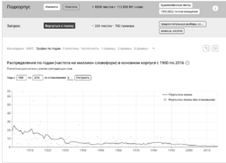
Fig. 5 Données de fréquence pour mamaša ‘(la) petite mère’ en emploi adressatif.

Son emploi adressatif (y compris sous la forme du néo-vocatif mamaš ) est en baisse depuis le début du XXème siècle et cette tendance est toujours actuelle. En effet, si entre 1950 et 1969 la fréquence était de 5, aujourd’hui, elle est de 1 par million de mots.