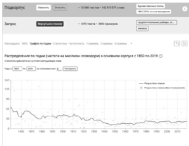
Fig. 4. Données de fréquence pour mamaša ‘(la) petite mère’. Source : NKRJa.

Pour observer l’évolution du terme mamaša , nous prenons une période même plus large que nous nous sommes fixée ici, car il est intéressant de constater qu’il était au moins trois fois plus employé sur la période 1850-1929 qu’en 1945, puis, sa fréquence a remonté légèrement à la fin des années 1970 pour se maintenir à peu près au même niveau jusqu’aujourd’hui. Actuellement, ce terme peut être ressenti comme moqueur ou ironique.