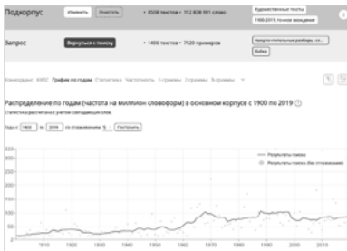
Fig. 3. Données de fréquence pour babka ‘grand-mère’ / ‘vieille’.

Malgré son potentiel péjoratif, l’appellatif babka présente deux augmentations majeures de fréquence 10 : dans les années 1960, puis, après une légère décrue, une nouvelle augmentation entre 1988 et 1998, dépassant la fréquence de deduška ‘grand-père’, terme qui était pourtant bien plus utilisé jusqu’alors. Nous méfiant de l’homonymie au pluriel entre babki ‘les vieilles’ et le pluriel tantum babki ‘pognon’ qui pourrait entraîner une déformation des données de fréquences, nous avons vérifié les fréquences pour babka au singulier et avons constaté des tendances similaires à celles du pluriel.