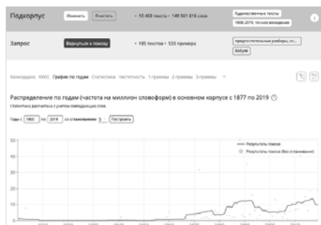
Fig. 9. Données de fréquence pour babulja 'mamié'.

L'usage de l'appellatif familial babulja 'mamié' s'est répandu depuis la fin des années 1960, sa fréquence la plus forte a coïncidé avec la période de la perestroïka 1985-1991, puis, après une période de baisse, il retrouve le niveau précédent entre 2009 et 2015. Ce terme figure dans 185 textes littéraires ce qui rend son usage comparable à celui de starikan 'vieux'. En revanche, l'appellatif correspondant masculin dedulja 12 'papi' n'apparaît que dans 62 textes littéraires de notre corpus et sa fréquence est quatre fois inférieure à celle du terme babulja .