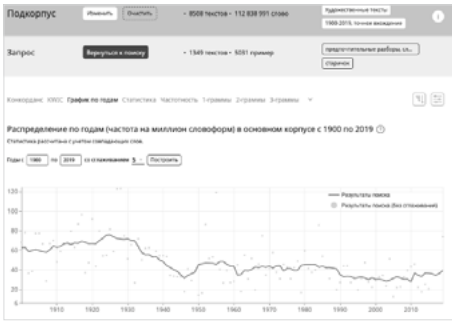
Fig. 16. Données de fréquence pour staričok '(un) petit vieux'.

Depuis les années 1950, dans un registre familial, il est adressé principalement aux allocuteurs d'un âge quelconque, le tutoiement est pratiquement systématique.