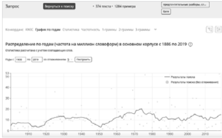
Fig. 10. Données de fréquence pour batja ‘père’.

D’après la courbe des fréquences cumulées, l’emploi de l’appellatif batja dans notre corpus littéraire a été le plus important entre 1965 et 1980 et il se maintient depuis à un niveau supérieur à 10 occurrences par million de mots (fig. 10).