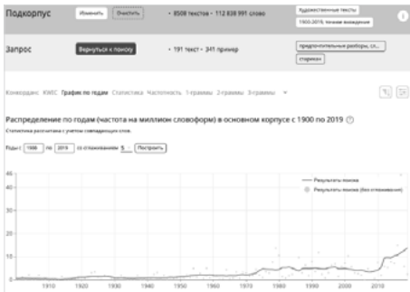
Fig. 11. Données de fréquence pour starikan ‘(un) vieux’. Source : NKRJa.

Quant à l’appellatif masculin familial starikan ‘(un) vieux’, il ne marque pas de lien de parenté. Son usage est moyennement généralisé (il figure dans 191 textes littéraires) et on observe une légère augmentation de fréquence à partir de 1975 avec plus qu’un doublement en 2011 : de 5, elle passe à 13.