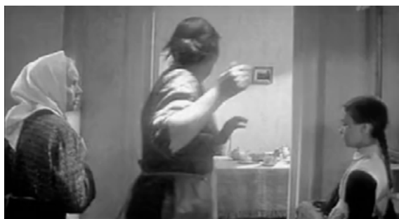
Fig. 6. Image extraite du film « A esli éto ljubov' » (1961).