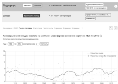
Fig. 12. Données de fréquence pour starikaška ‘vieux’. Source : NKRJA.

Le terme starikaška ‘vieux schnoque, vioc’ est très péjoratif, moins employé entre 1935 et 1955, sa fréquence est en augmentation depuis par vagues successives, mais elle reste moyennement significative. Ce terme apparaît dans 246 textes dans notre corpus littéraire et dans 9 films. Dans ces films, il est employé en tant qu’adressatif trois fois dont deux visant un allocataire plutôt jeune.