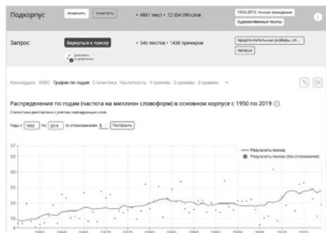
Fig. 7. Données de fréquence pour papaša 'père' / '(le) petit père' (par million de mots, moyennée sur une fenêtre glissante de cinq points de données). Source : NKRJa.

Sur la période étudiée, la fréquence de l'appellatif papaša a connu une augmentation progressive, légèrement en dessous du terme mamaša jusqu'en 2010, le dépassant de peu depuis. Au fil du temps, il s'est chargé également d'une connotation plutôt péjorative.